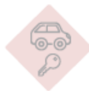
Unidad móvil y custodia de llaves