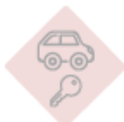
Unidad móvil y custodia de llaves