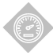
Control de velocidad