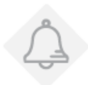
Sensores de seguridad