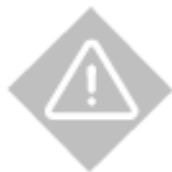
Zonas de peligro/seguridad